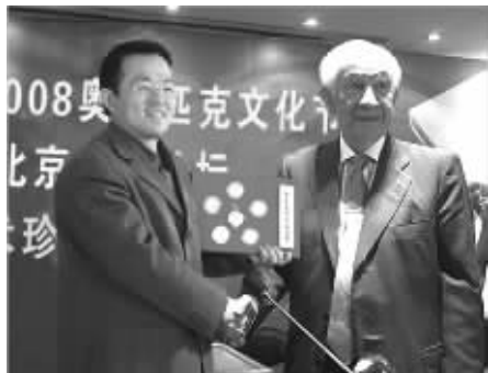
在第五届北京2008奥林匹克文化节,“人文奥运·2008翡翠金钻表”作为尊贵国礼,被赠送给国际奥委会终身名誉主席萨马兰奇永久收藏。

百年奥运第一套“翡翠金钻表”诞生 国际奥委会终身名誉主席萨马兰奇特地题词:用时间来纪念 2008