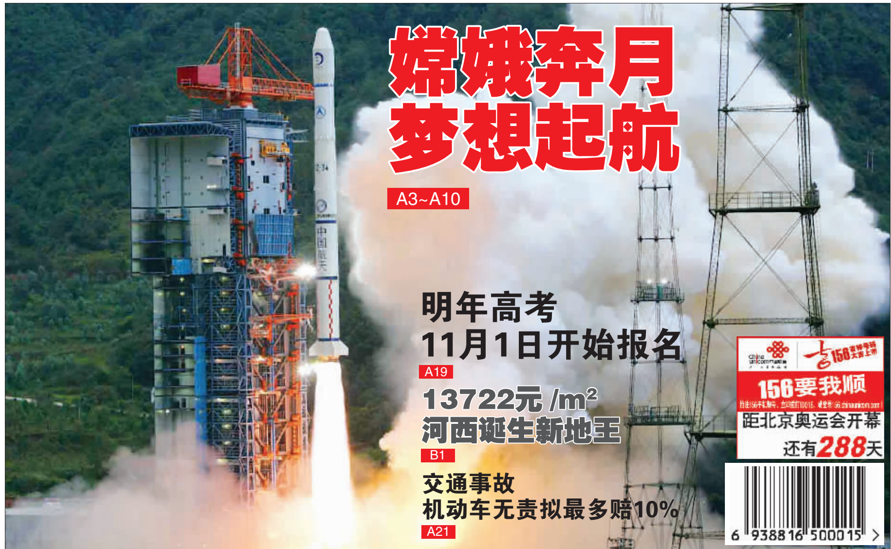
10月24日18时05分,搭载着我国首颗探月卫星“嫦娥一号”的长征三号甲运载火箭在西昌卫星发射中心三号塔架点火发射。

责编:杜雪艳 美编:时芸 组版:巫忠伟 统一刊号:CN32-0104 邮发代号:27-67 第3029期 总第3895期 彩票开奖公告详见A34版