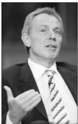
布莱尔讲演很值钱

古采里耶夫本身为印古什人,早期做工人,后来做家具生意,拥有一定资本后,办起银行,在车臣、印古什地区成为著名企业家。 庄北宁(新华社供本报特稿)