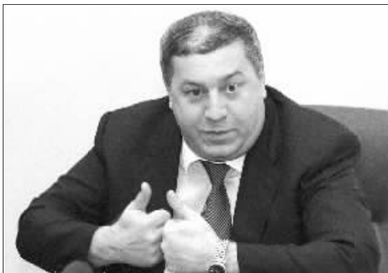
米哈伊尔·古采里耶夫

俄罗斯亿万富翁米哈伊尔·古采里耶夫自今年8月起神秘失踪,传言说他藏身英国。俄方正在全球通缉这名流亡大亨。英国《星期日邮报》网站28日披露,古采里耶夫已经在英国秘密申请政治避难。