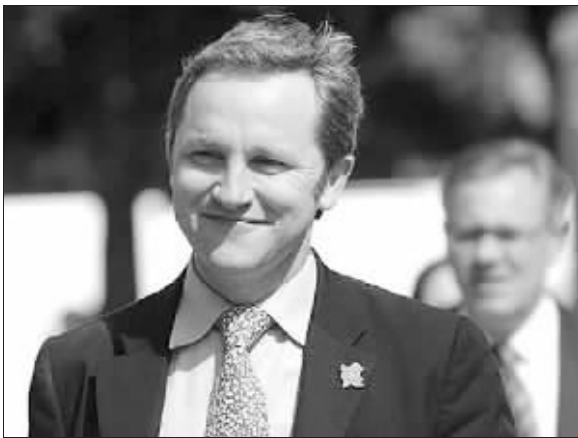
英国文化、新闻和体育大臣詹姆斯·珀内尔

虽然珀内尔本人否认知情主办方修改照片的做法,但根据英国《星期日电讯报》本月28日公布的电子邮件记录,主办方修改照片前已经事先告知珀内尔。