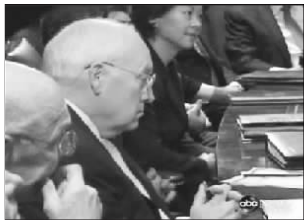
无人打扰切尼的清梦

加州山林大火已经肆虐一周,导致10多人丧生,近百人受伤,64万人无家可归,数千所房屋以及20多万公顷山林被毁。 王辉