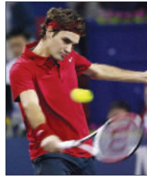
费德勒在比赛中回球