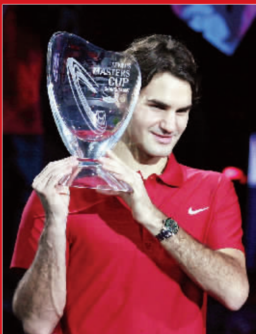
费德勒在颁奖仪式上