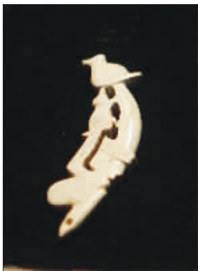
透雕人兽鸟玉饰件