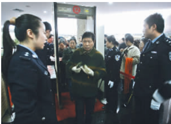
进门参观得通过安检

昨天下午3:00,南京博物院18件“镇院之宝特展”正式对外开展。为了一睹国宝风采,市民们在展厅口排起了“长龙”。因为展厅对观众人数有严格限制,不能超过100人,但凡超过,后面的观众就必须在门外排队,里面出来一个,才能相应进去一个。除了保安,公安武警也出动了,安保总数近50人。快报记者 胡玉梅