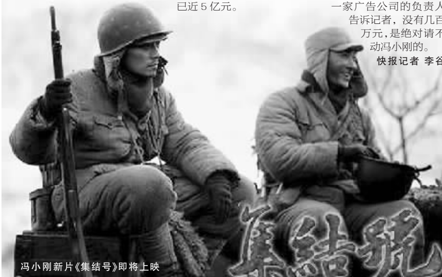
冯小刚新片《集结号》即将上映