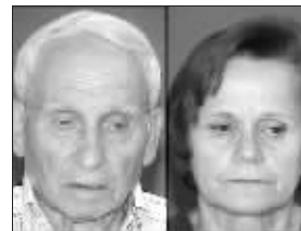
阿龙·别尔斯基和妻子

在第二次世界大战时期的东欧,有一位被世人认为堪比辛德勒似的救人英雄阿龙·别尔斯基,他与三个哥哥反抗德国纳粹的大屠杀,用武力营救了大约1200名犹太人。别尔斯基兄弟从此被人们尊为英雄,他们的壮举也被编入书籍和文献,甚至好莱坞明年都准备将他们的英雄事迹搬上银幕。然而世事难料,最近别尔斯基兄弟中唯一的健在者、现年80岁的阿龙·别尔斯基却因被指控诈骗而被捕,让人大跌眼镜。