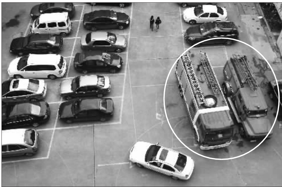
消防车常年停在宾馆院内的露天停车场

在南京,有这样一支武警消防部队:没有营区,所有战士一年多来都住在实际上是招待所的宾馆里;没有炊事班,战士们用一天只有14元的伙食费在小饭店里搭伙;没有消防车车库,消防车只能停在停满了社会车辆的停车场里——而他们的训练场,就是停车场的夹缝空地。 这就是南京消防莫愁路中队,一个负责3.8平方公里辖区的中队。这个辖区掌管着南京市最繁华的地段——包括了40多家商场在内的新街口地区。因为南京市妇幼保健院的扩建,这个中队让出了原有的消防站,转而在宾馆里过渡。但由于种种原因,承诺中的建站计划迟迟没有着落,莫愁路中队的18名战士只得在宾馆里过渡,同时努力尽责地完成了各项消防出警任务。能够拥有自己的营区,也成了他们现在唯一的希望。