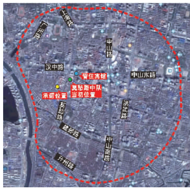
莫愁路中队辖区示意图