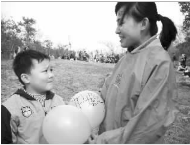
环保志愿者向小朋友发放气球