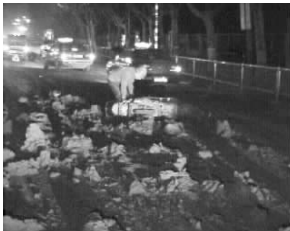
摩托车手“人仰马翻”