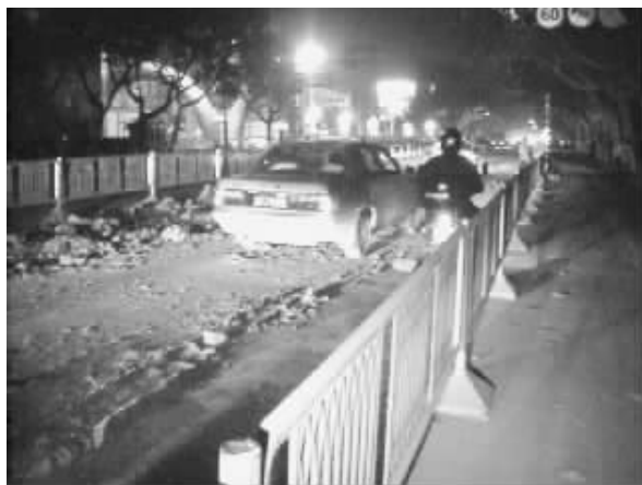
中央路上全是烂泥