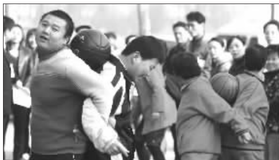
“背靠背折返跑”,合作默契才跑得快