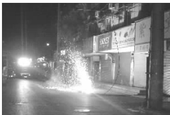
高压线坠地,火星四射

快报讯(见习记者 李彦)前晚,南京网巾市14号附近,一段10千伏高压线突然断裂起火,导致周围千余户居民家中停电。