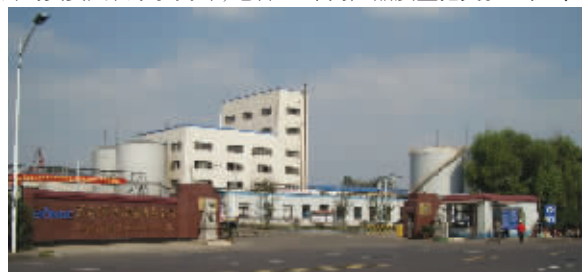
图为位于南京新港开发区的“豆维家”精炼一级大豆油生产基地——邦基(南京)粮油有限公司

还了解到,邦基公司在南京的检测中心也将设在南京,到那时还将有更为强大的检测技术为产品质量把关。程佳