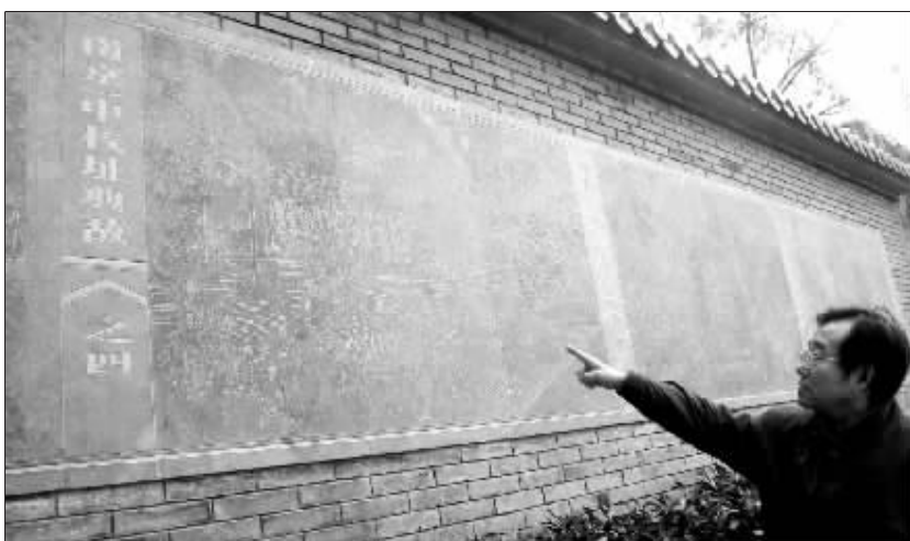
在南京一中礼堂旁边的浮雕墙上刻有“刺马案”的情节。

137年前,就在现在的南京一中操场,马新贻被张汶祥刺杀。如果他们真如传说中的“兄弟”,那《投名状》里的故事就发生在这里——