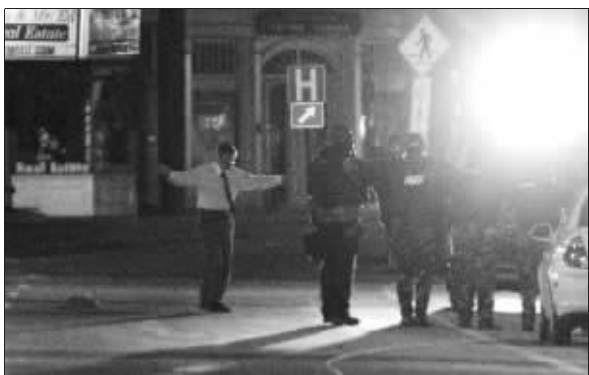
11月30日,艾森伯格(左)向警方投降。