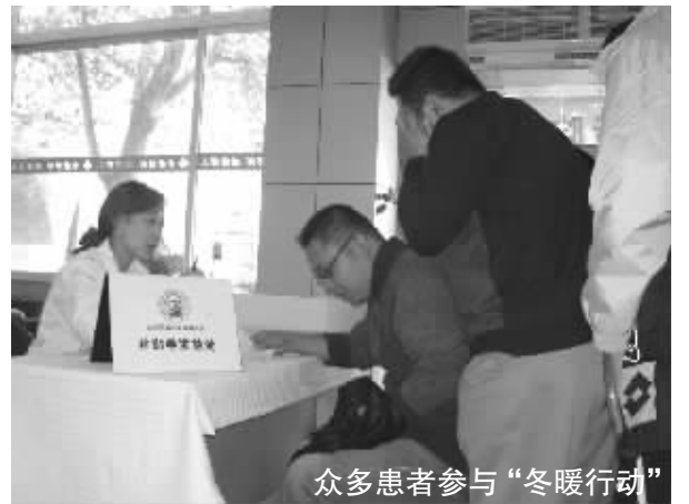
众多患者参与“冬暖行动”

据了解,在男科治疗援助“冬暖行动”期间,由于白求恩基金会提供单次援助100元到2000元不等的资金,某些病种治愈费用要比平时节省将近50%。因此,基本治愈男科疾病的费用大幅度降低。且有专业医师亲自坐诊,很多男性朋友都趁这段时间前来治疗。据中国性学会现场统计,截至12月2日,活动开展两个多月,已有6000余名患者接受了白求恩基金会提供的治疗援助。