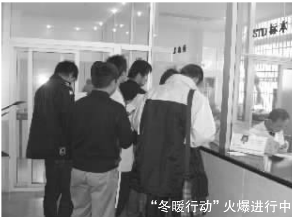
“冬暖行动”火爆进行中

据悉,“冬暖行动”正在位于长乐路238号南京建国男子医院火热进行中。涉及的治疗项目有:早泄敏感神经阻断术、前列腺增生扩裂术、慢性前列腺炎强力透膜螺旋场效应治