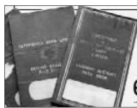
托马斯拿着 3 份 42 年前的银行存折(下图为存折)