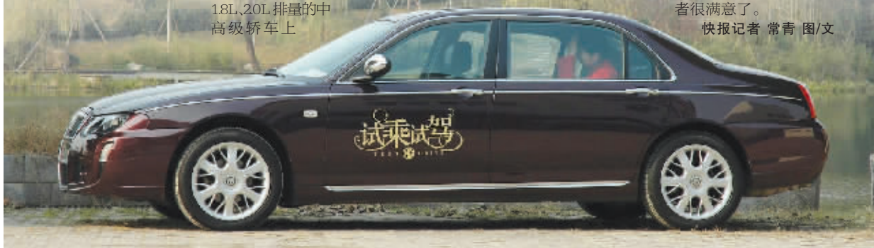
图中所示实际是装配了 2.5 升 V6 发动机的 MG7L,论驾驶乐趣则远不及 1.8T 的 MG7。