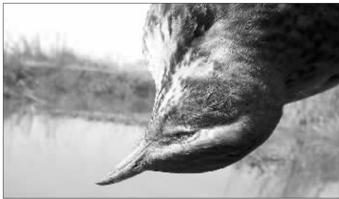
被黑网捕杀的鸟儿“凝固”在空中,等待布网者前来收获