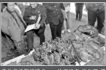
查处非法野味摊点

据了解,时下正值初冬季节,野生动物为过冬经常出动捕猎食物,南京的汤山、青龙山一带,成了许多非法猎猎者偷猎的主要场所,甚至连附近的句容也未放过。记者对此进行了连日暗访。