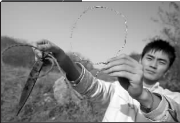
山上密布的钢丝扣