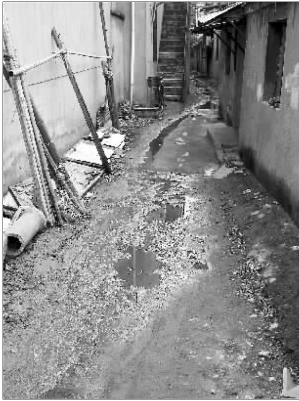
两三米宽的巷子到处是积水

记者来到凤游寺社区,一听是豆腐坊那条路,社区工作人员也连连摇头。“这条路我们知道,居民反映了多次,确实该修。”社区马主任说,“但问题是谁来修?社区没有修路的钱呀!”他表示,以前还找过房管部门,得知这条路以前属于金双强企业宿舍区内部的路,按理