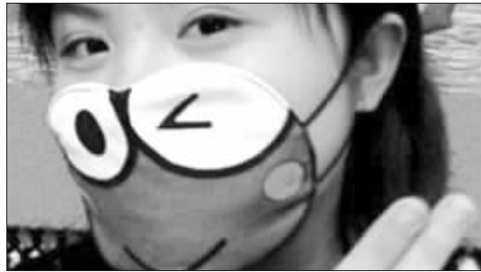
卡通口罩好看但不利于健康 (资料图片)

里,记者看到,销售的口罩杂乱地堆放在一只塑料篮里,图案和颜色各不相同,价格大多在2元钱左右。这些口罩只是用塑料袋简单封装了一下,上面虽有“时尚卡通口罩青岛制造”的字样,却没有生产厂家的任何信息。询问老板有没有白色的棉纱口罩,他摇摇头说:“那个早就就不流行了。”