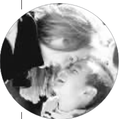
安吉丽娜·朱莉经常带着大养子马克斯外出玩耍