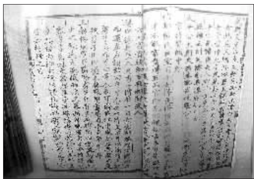
古代相面书《古今识鉴八卷》