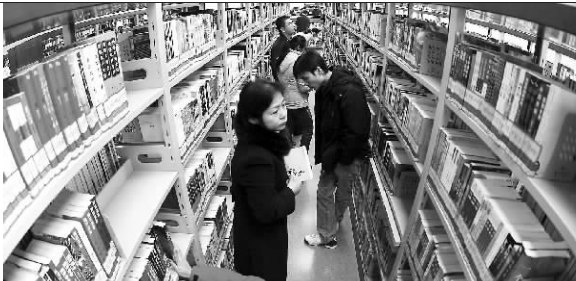
南京图书馆新馆全面开放,新启用的中文图书借阅室。