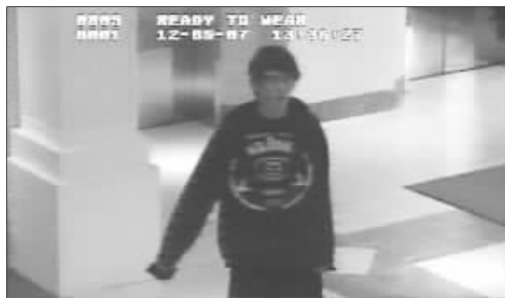
凶手霍金斯的录像截图

霍金斯生前的邻居7日指责当地警方官僚作风严重,导致他们案发前有关霍金斯的报警信息无人理睬,错过避免血案发生的机会。