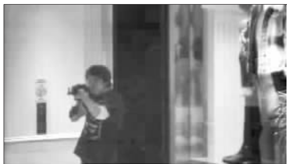
凶手霍金斯射击时的录像截图