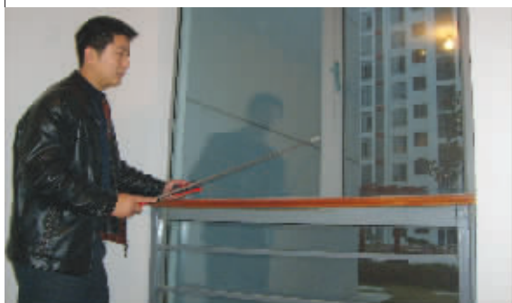
一楼户外没做安防