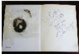
图为被夹在书中的一缕列侬的头发,右侧是列侬亲笔写的字

彼得·贝斯特组成了乐队“披头士”(又译“甲壳虫”)。1962年12月发行了首张单曲引起巨大轰动。1964年“披头士热”迅速在世界范围蔓延。1968年,列侬与日本先锋艺术家大野洋子相识,第二年结为夫妇。他的这一系列举动向世人暗示了“披头士”的解体已为期不远了。果然,1970年乐队宣布解散,1971年列侬和大野洋子移居美国纽约。1975年,儿子的出生使列侬放弃了一切音乐活动,流行乐坛有5年之久没有听到他的声音。1980年,和大野洋子的新作《双重幻想》似乎预示着列侬将有更多的佳作问世。但在当年12月8日,列侬在自己的寓所前被一名患精神病的男子枪杀,时年40岁,举世震惊。