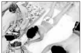
晒太阳能促进吸收维D

2007年即将成为过去,各种年终盘点纷纷出炉。医学发现是人们关注的焦点之一,在即将过去的一年里,科学家在这一领域又有了许许多多、大大小小的发现和发明。以下是《时代》杂志评选出的年度十大医学突破。