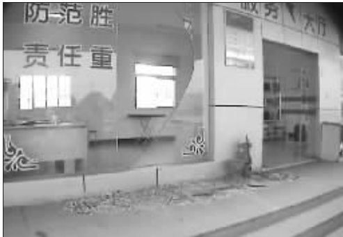
周边单位门窗受损