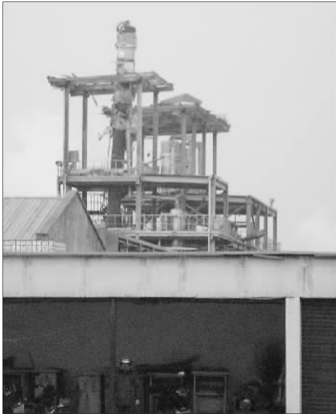
发生燃爆的蒸馏塔

据了解,事故原因是该公司“试蒸”化工产品时,10多米高的“蒸馏塔”突然剧烈燃爆,包括总工程师在内的4名工作人员被严重烧伤,附近数名居民受轻伤。