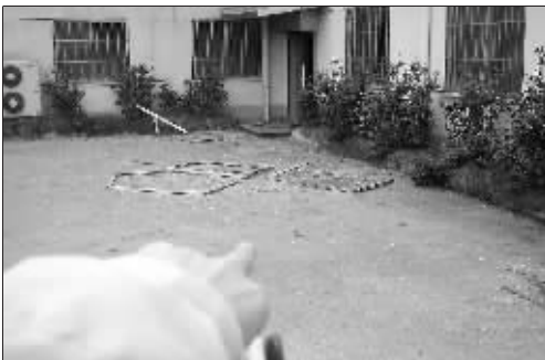
隔壁的电力所门窗被炸飞