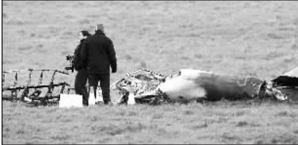
其中一架飞机残骸损毁十分严重

当地时间 12 月 16 日下午,2 架轻型飞机在英国斯塔福德郡一个小村的 550 米高空飞行时,竟然凌空相撞,其中一架飞机当场坠毁,机上 2 人当场遇难。但另一架飞机在被撞出一个大窟窿后,竟仍“摇摇欲坠”地继续飞行了大约 48 公里,最终设法紧急着陆,机上飞行员和 2 名乘客幸运生还。当地警方已对此事故展开全面调查。