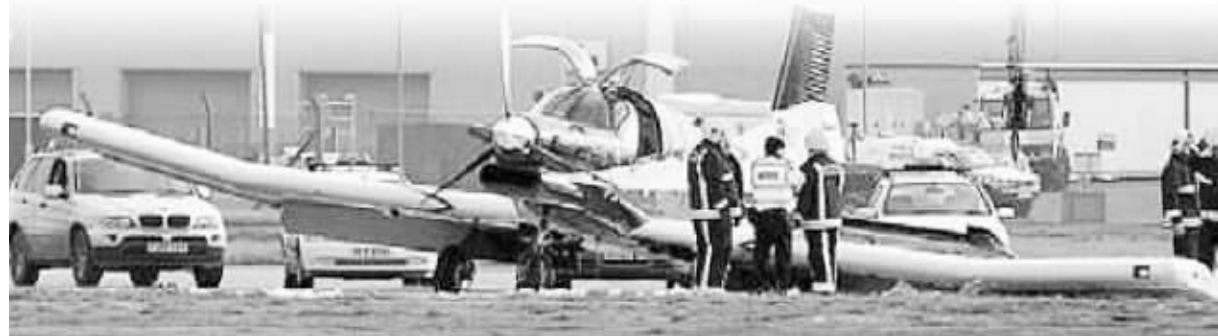
另一架飞机摇摇欲坠飞了 48 公里后成功降落,机上人员奇迹生还

在过去 12 个月中,做了缩胃手术的科林体重急剧下降,到目前为止,他的体重已经减到了 101 公斤。 综合