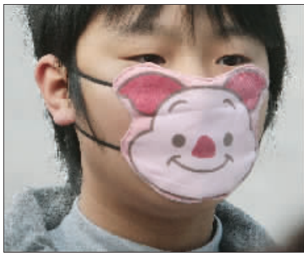
专家建议市民戴着口罩对付雾霾。

据介绍,雾产生的较大湿度和雾粒本身,会危害呼吸系统,引发咳嗽、哮喘等症状;雾天里风力小空气流动慢,空气中含有的各种病菌、悬浮物 and 有害化学物质比平时多,会加重患有慢性支气管炎、哮喘等疾病的“老病