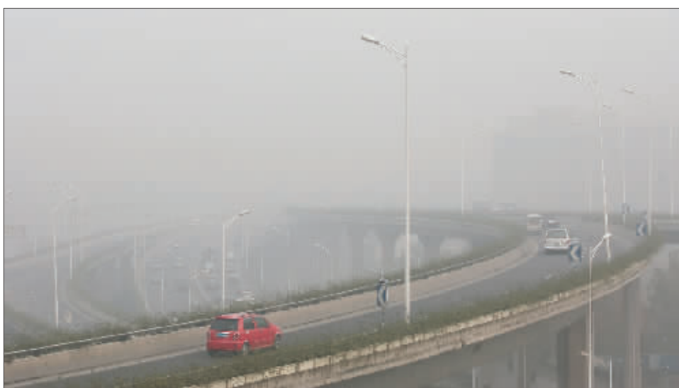
笼罩在大雾中的南京城