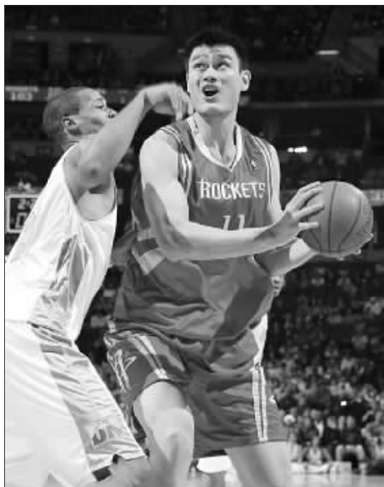
姚明一人独木难支

这是火箭队最近6场比赛中输掉的第五场。目前他们12胜14负,胜负率创赛季新低。圣诞节前,他们将客场分别挑战公牛和活塞队。 梁金雄