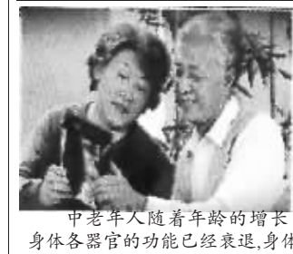
中老年人随着年龄的增长,身体各器官的功能已经衰退,身体

染发引起各种疾病,属于染发危害的高危人群。五贝子天然染发不同于化学染发,不含苯二胺和铅,主要成分为植物色素,从根本上杜绝了染发危害的产生,健康安全。所以,给爸妈染,要选天然健康的五贝子染发产品。