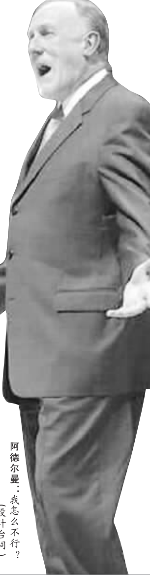
阿德尔曼:我怎么不行? (设计台词)

姚明说:麦蒂上场时无疑会给全队带来很大帮助。一旦没有了他,生活还要继续,比赛还要打下去。”