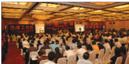
“对话中国”活动在长三角地区引起巨大反响