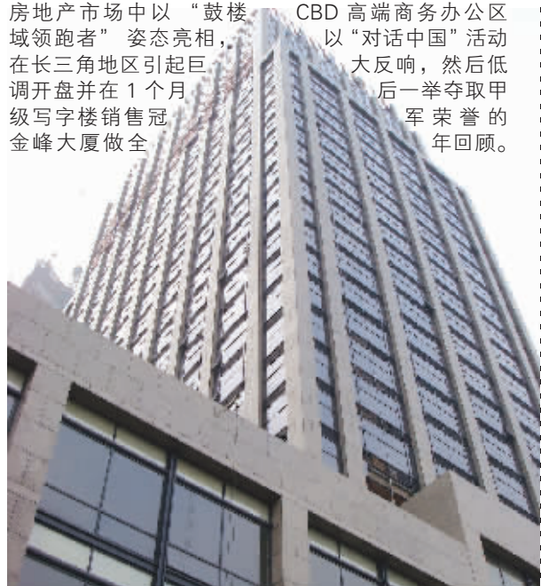
金峰大厦以“鼓楼 CBD 高端商务办公区域领跑者”姿态亮相

同一个原因来到同一个地方,南京房地产市场2007年度活动的最强音由此出炉。活动中两位贵宾谈到的很多见解逐步应验,两位贵宾提出的很多问题至今仍是各种政策与法规着重解决的对象。活动规模、流程安排、贵宾级别、甚至举办场地金陵饭店活动当天排起的数百人的长队,都把活动主办与协办单位的执行与策划能力表现得淋漓尽致,国内某一线媒体给出的评价简单明了:大家风范,大师手笔。