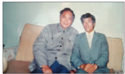
孙老生前和“年纪最小的朋友”在一起