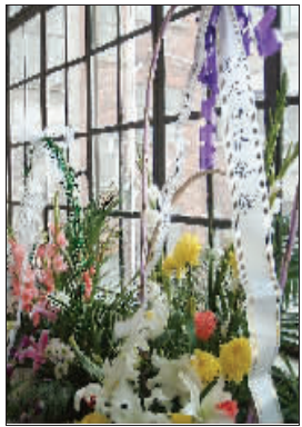
孙老家门口也摆满了鲜花

昨天上午,记者赶到孙老家中时,看到各方送来的大小花篮已经从屋内排到了屋外。灵堂的电视中正在播放着孙道临的专题