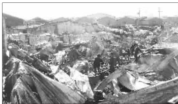
民警和消防正在清理火场