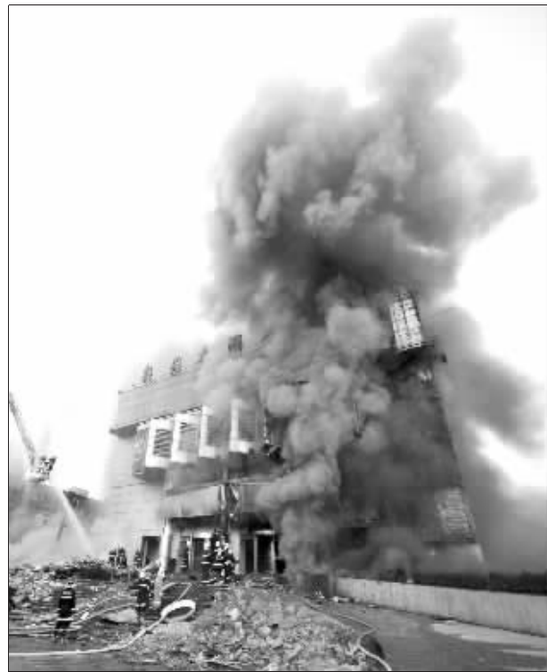
消防队员扑救大火

同样来自安徽的李氏父子俩,手背均被烧伤。火灾发生后,李父眼看大火就要吞噬市场,冲进火海中抢运自己的摩托车。见父亲冲进去了,儿子小李赶紧前去帮忙,不料两人手背均被烧伤。