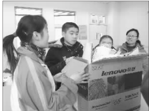
盲学生开心地收下旧挂历

华主任介绍,由于盲文属于触摸文字,因此对于盲文纸的要求就很高,挺、硬、厚、脆是纸张的基本要求。因为盲文纸的要求高,所以价格也高,平均0.12元/张,而且南京没有盲文纸出售,