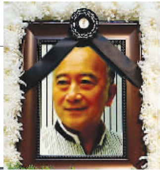
昨天上午,上万人顶着寒风,自发来到上海龙华殡仪馆,参加电影表演艺术家孙道临的追悼会。 详见 A28 版