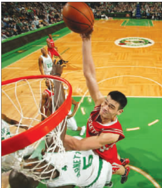
姚明在加内特头上爆扣

北京时间昨天,火箭迎来了新年的最大挑战,在麦蒂缺阵的情况下,姚明带领着火箭客场挑战凯尔特人。火箭在第一节落后20分的情况下奋起直追,虽然一度将比分反超,但在最后决定胜负的关键时刻却被“狼王”加内特“咬”得遍体鳞伤,最终以93:97客场败给了由“铁三角”组成的凯尔特人。姚明拿到了19分、13个篮板。