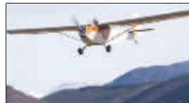
“伊莱克特拉”电能载人飞机