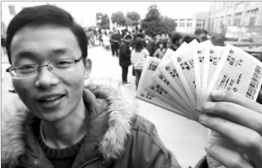
这名学生不出校门就拿到了自己和同学春节回家的车票。

据介绍,从今天开始至2月2日,学生不出校门就可以购买2月13日-3月2日期间的返程车票。