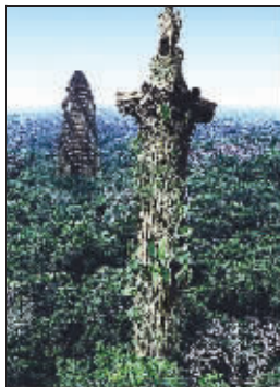
没有人类的地球将变得荒芜

不过,你也许只能开上十几年的车,因为在20年后,地球上大多数道路都将无法通行。50年后,原来的公路上甚至还会长出一棵棵大树。