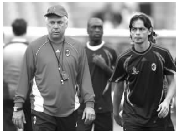
AC 米兰大牌云集,难怪国足心不在焉 资料图片

在 AC 米兰的 451 阵型中,突前的单前锋是因扎吉,随后是卡卡、西多夫两个攻击型前卫,然后是三名中前卫,福拉多也希望在国足阵中移植类似圣诞树的阵型。因此他经常会和球员提起 AC 米兰,甚至也给记者讲解 AC 米兰的战术。对于现阶段的国足而言,福拉