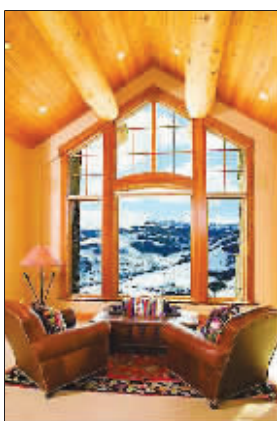
别墅内部以温馨家庭的觉为设计主题,远处就是落基山

在美国蒙大拿州,坐落着一个全球独一无二的私人高尔夫球和滑雪俱乐部,会员身家丰厚,只要提交资产证明、付约214万元人民币入会费、13万元年费,再买一座近亿的度假别墅,就能与世界首富或传媒大亨为邻,享受这个称为富豪村的人间伊甸园——黄石俱乐部。如果你有更多钱,约43亿元便可买下整个伊甸园,因为老板夫妇正闹离婚,要把俱乐部出售。