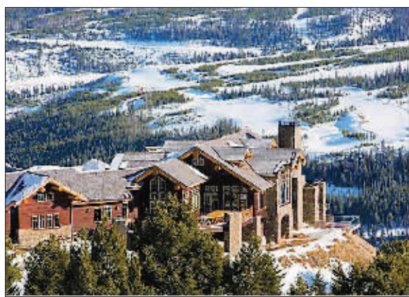
黄石俱乐部是世界上海拔最高的豪华俱乐部,最大的卖点是一座座美丽别墅,全部坐拥落基山脉