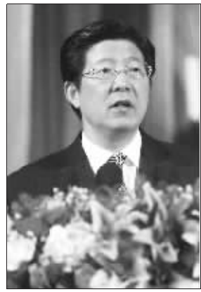
南京市市长蒋宏坤代表市人民政府向大会作工作报告

10日上午,南京市十四届人大一次会议成为市民关注的焦点。市长蒋宏坤代表南京市人民政府向大会作工作报告。过去5年中,本届政府领着南京人,让大家的日子越过越美满。2007年顺利实现了总体达全面小康的目标。和2002年相比,去年南京城镇居民人均可支配收入增长了106%!