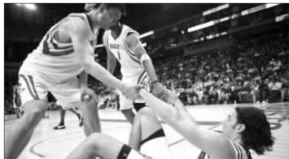
姚麦拉里斯科拉,火箭队目前很团结

北京时间昨天凌晨,火箭在主场以96:89击败弱旅超音速,取得两连胜。姚明拿下30分、17个篮板,全场19投12中,依然替补上场的麦蒂得了17分。