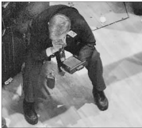
美国股市大跌，一位股民心痛不已

美国最大的银行花旗集团15日公布，他们在去年最后一个季度就亏损了将近100亿美元，这是该银行历史上最大的季度亏损之一，也是花旗集团在现代历史中首次亏损。据报道，花旗银行发生巨额亏损的原因是源于美国房地产业的坏账。