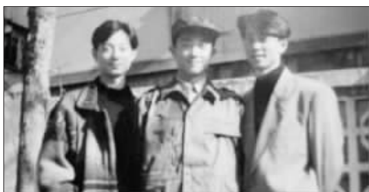
三胞胎在2000年的合影

子怀孕七个月多时,三个孩子就在鼓楼医院出生了。“那时我们都等在外面,老半天了都没动静。”刘先生说,过了好久,护士跑出来,面带喜色地告诉他:“刚生了一个,可能还要生一个。”过一会儿,又来报喜,“第三个也生下来了!”