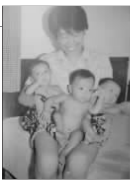
三胞胎出生后不久