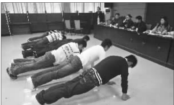
面试现场,男生集体做俯卧撑

南京京华医院 诊疗科目:妇科 QQ咨询:200856408 妇科疾病咨询:025-86640022 意外怀孕咨询:025-84540781