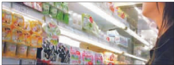
货架上有不少益生菌牛奶