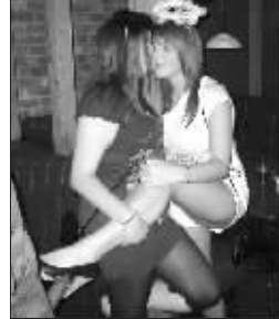
和女伴进行色情拥抱