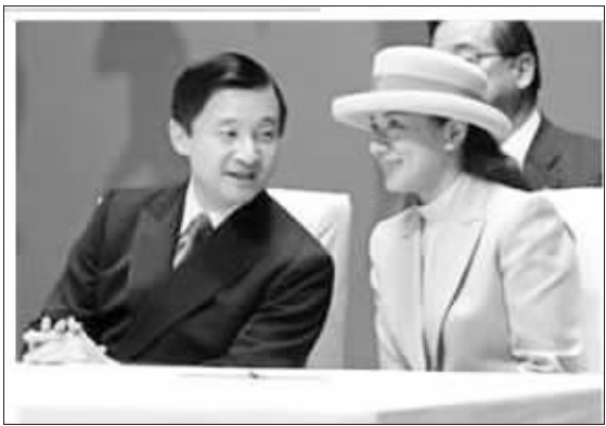
雅子妃和丈夫德仁太子

1月27日出版的日本媒体爆出惊人内幕,日本73岁的皇后美智子和44岁的大儿媳“平民王妃”雅子爆发“婆媳大战”。由于罹患忧郁症的雅子妃长期以“身体不好”为理由缺席王室重大活动但却有大量精力四处逍遥享受“私生活”,引发婆婆美智子强烈不满,双方为此甚至发生激烈争吵。此后,美智子被迫亲自打理各种皇室事务,日前终因操劳过度而病倒。内幕人士称,皇后美智子可说是生生被雅子妃“气病”的!据悉,这一内幕在日本引发轩然大波,但也有专家指出,同为平民出身的美智子实际上是体谅雅子的苦处,为了庇护儿媳才把自己累病的。