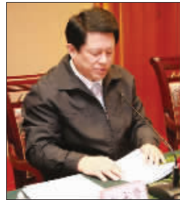
江苏省人事厅厅长赵永贤

此外,对于初、高中毕业未能继续升学的“两后生”、退伍军人等新增劳动力,我省将依托各级各类职业教育资源,开展技能教育,力争帮助他们全部找到合适的岗位。我省正在调研,拟对人均年收入低于2500元的贫困人口重点扶持,由政府出资,