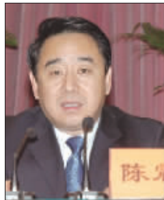
江苏省劳动保障厅厅长陈震宁

在江苏省政府今年要切实办好的改善民生十件实事中,就业依然名列第一位。罗志军代省长表示,2008年江苏将继续实行积极的就业政策,切实帮助困难群众就业。零就业家庭高校毕业生由政府实行保底就业,保持零就业家庭当年动态清零。年内新增城镇就业85万人以上,下岗失业人员再就业25万人。