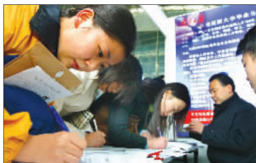
大学生在招聘会上进行登记 (资料图片)